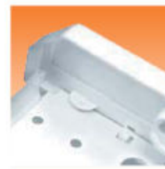
Крепление торцевой крышки